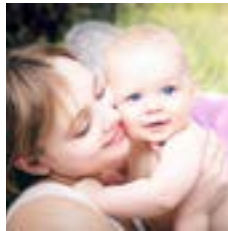
Baby und Stillgruppe