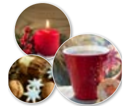
30. Schlägler Advent