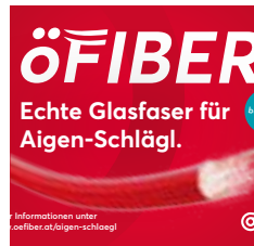
Aktuelles zum Glasfaser Projekt