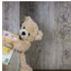
Familienförderungen des Landes OÖ