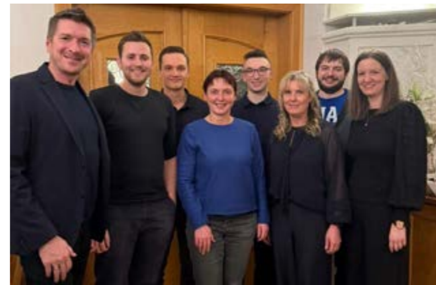
Der neue Vorstand.

Ausblick: Freitag, 24.04.2026: Konzert des JBO Böhmerwald im Vereinshaus