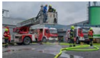
Feuerwehr Übung Firma Resch