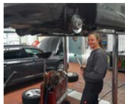
KFZ-Technik - VW Audi Kneidinger

Ein weiteres Highlight für die Techniker war der Tag der offenen Tür der Energie AG in Gmunden. In den Lehrwerkstätten erhielten sie Einblicke in die Vielfalt an Ausbildungsmöglichkeiten. Das abwechslungsreiche Action-Programm (Kran fahren, E-Mobilität mit Segways, Masten klettern ...) kam bei den Jugendlichen sehr gut an.