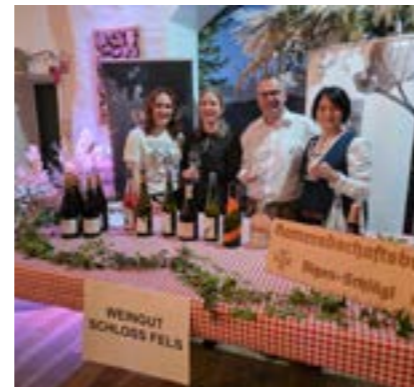
Der Weinstand von Schlossfels betreut durch den KB

los ablief – vom Aufbau über den Ausschank, bis hin zur Betreuung der Gäste. Die Weinmesse war erneut sehr gut besucht, was die Bedeutung dieser Traditionsveranstaltung für die Region einmal mehr unterstrich. Bei stimmungsvoller Livemusik, guten Gesprächen und einer reichen Auswahl an ausgezeichneten Weinen verbrachten die Besucherinnen und Besucher viele angenehme Stunden. So wurde auch diese Weinmesse zu einem besonderen Tag im Vereinsjahr, der noch lange in guter Erinnerung bleiben wird.