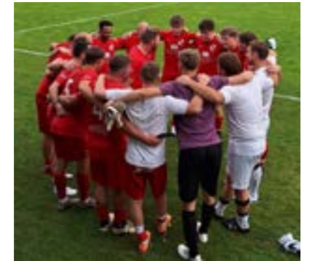
Herbstmeistertitel für die 1b-Mannschaft

Der UFC Aigen-Schlägl bedankt sich herzlich bei allen Sponsoren, Unterstützern, Helfern und Fans