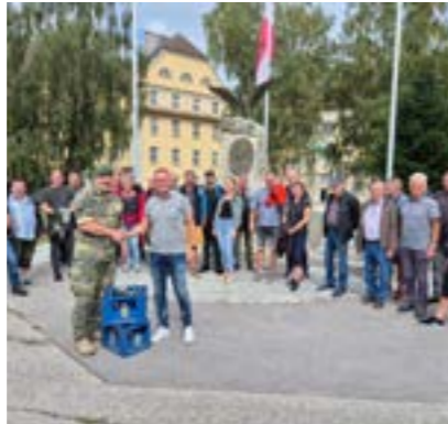
Gruppenfoto mit dem Kommandanten

kameradschaftlicher Tag verbracht werden konnte.