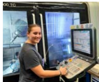
Zerspannungstechnik - Röchling