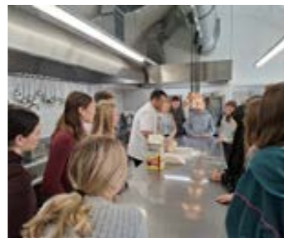
Küchenbetrieb - Stift Schlägl