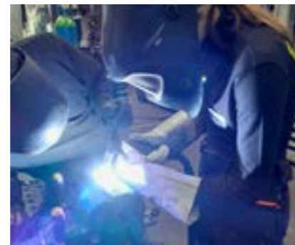
WIG-Schweißen - TruckCenter

Die Techniker besichtigten die Firmen Biohort, Ascendor und Tischlerei Andexlinger. Im Rahmen eines Projektnachmittages arbeiteten die Schüler im Truck Center im Stationenbetrieb mit (Bus, LKW, Schlosserei, schweißen und lackieren, ...)