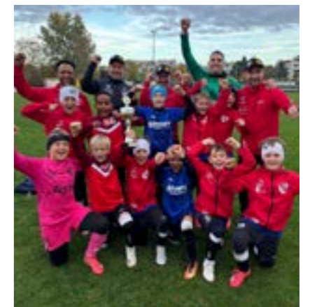
Platz 4 für unsere U11-Mannschaft beim Cordial Cup Qualifikationsturnier in Wien