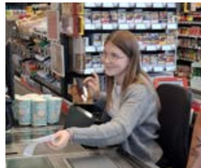
Kassabetrieb - EUROSPAR Jauker

Ein weiteres Highlight für die Techniker war der Tag der offenen Tür der Energie AG in Gmunden. In den Lehrwerkstätten erhielten sie Einblicke in die Vielfalt an Ausbildungsmöglichkeiten. Das abwechslungsreiche Action-Programm (Kran fahren, E-Mobilität mit Segways, Masten klettern ...) kam bei den Jugendlichen sehr gut an.