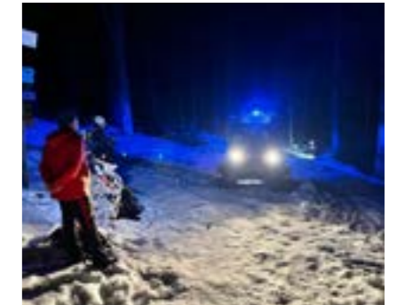
Verletzte Person am Goldsteig