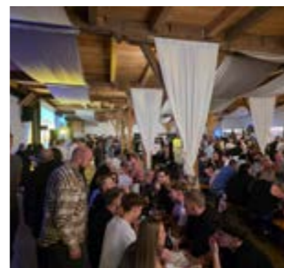
Viele Besucher im Meierhof Schlägl