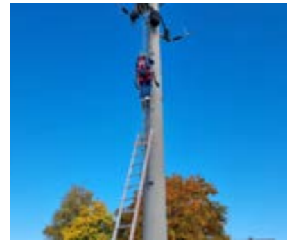
Mastenklettern - EnergieAG